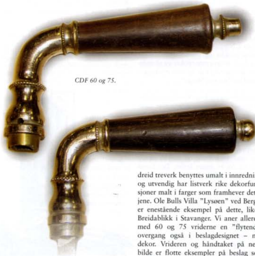
CDF 60 og 75.

eller i bronse. Nikkel kom til Norge ca 1880, krom ikke før ca 1925. På mer utførte vridere ble det benyttet andre teknikker, som vokstøpning og "perlerader" som krever spesielle støpeteknikker. Dette finner en på for eksempel de litt seinere modellene CDF 60 og CDF 75, to nesten like vridere, men 75 er litt større og har mer dekor.