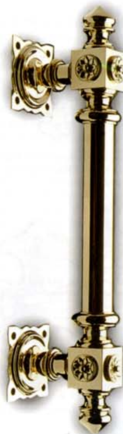
Portklinke CDF 154 og grepet 263 her gjen-skapt i serien Klassisk Norsk.) Legg merke til "rosen" på beslagene – Disse ble laget som løse deler og skrudd fast som en mutter. Rosen går igjen på i alt tretten forskjellige beslag i Trio katalogen fra 1911.

Kopiering og "lån" har nok vært utbredt. Man kunne kjøpe et fint beslag ute, ta det hjem, og med relativt små kostnader få opp produksjonen på en enkel måte, spesielt på sandstøpte beslag. Den innkjøpte vrideren var modellen. Det ble hentet flinke fagfolk fra Eskilstuna både til lås og beslagproduksjonene i Oslo og i Stavanger rundt århundreskiftet. Messing og etter hvert låsproduksjon foregikk hovedsakelig i Oslo, mens hengsler og trådprodukter fikk en vellykket produksjonsstart i Stavanger.